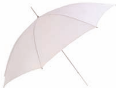
Obrázek 3.14: Bílý difúzní deštník