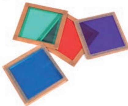
Obrázek 3.8: Barevné filtry