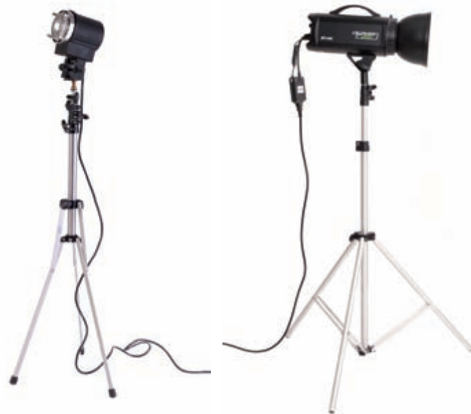
Obrázek 3.2: Stálé světlo

Voštinový filtr – používá se opět ve spojení s reflektory nebo komínkem. Pomáhá vést světlo přímo. Omezuje únik světla mimo nasvěcovanou část objektu.