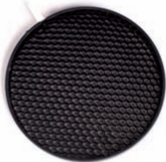
Obrázek 3.7: Voštinový filtr