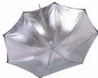
Obrázek 3.11: Stříbrný odrazný deštník