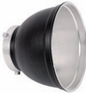
Obrázek 3.5: Reflektor