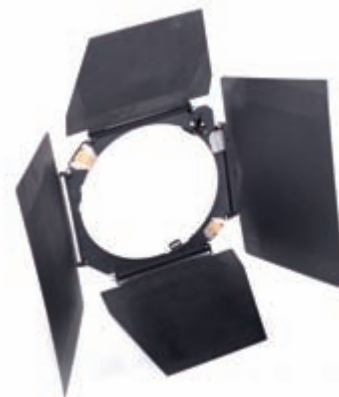
Obrázek 3.6: Klapky