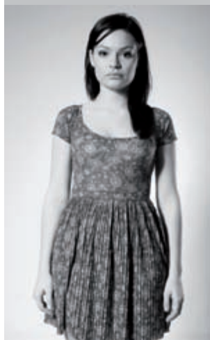
Obrázek 3.21 vpravo: Jedno bodové světlo zpředu – ze strany