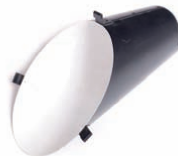
Obrázek 3.9: Pozadový reflektor