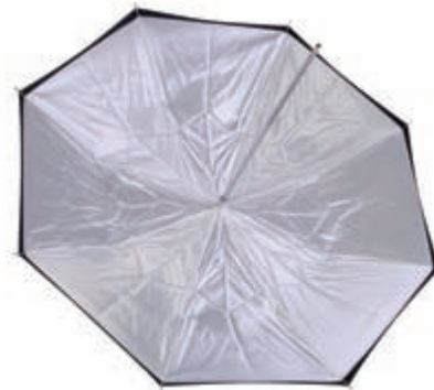
Obrázek 3.15: Bílý odrazný deštník