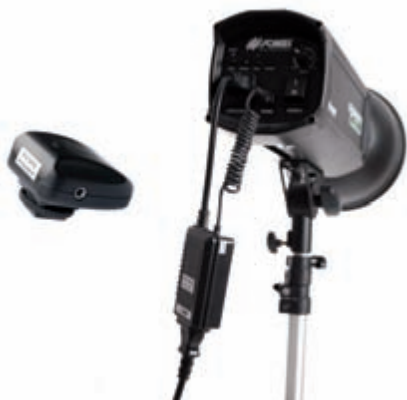
Obrázek 3.4: Odpalovací zařízení (bezdrátové)