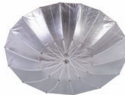
Obrázek 3.12: Stříbrná odrazná parabola