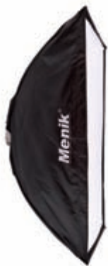
Obrázek 3.13: Softbox